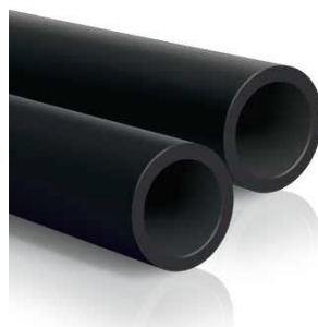
Figura 2 Tubi in PE liscio per lo scarico non in pressione

In accordo con quanto riportato dal decreto ministeriale n.56 del 21 marzo 2018, è possibile riportare nella medesima DIAP più prodotti afferenti tutti al medesimo prodotto rappresentativo come media, se gli impatti ambientali dei singoli prodotti rispetto al punteggio singolo (ottenuto come somma dei risultati pesati delle tre categorie d'impatto più rilevanti) non variano di \pm 10\% e se comunque questi ricadono tutti nella medesima