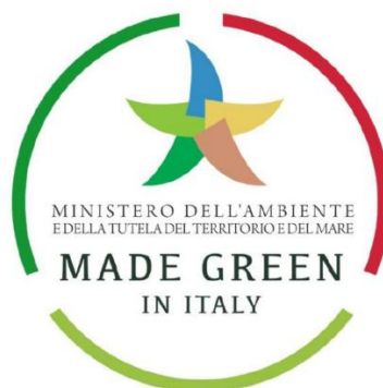
Figura 1 - Il marchio del "Made Green in Italy"